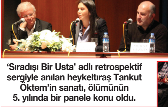
'Sıradışı Bir Usta' adlı retrospektif sergiyle anılan heykeltıraş Tankut Öktem'in sanatı, ölümünün 5. yılında bir panele konu oldu.