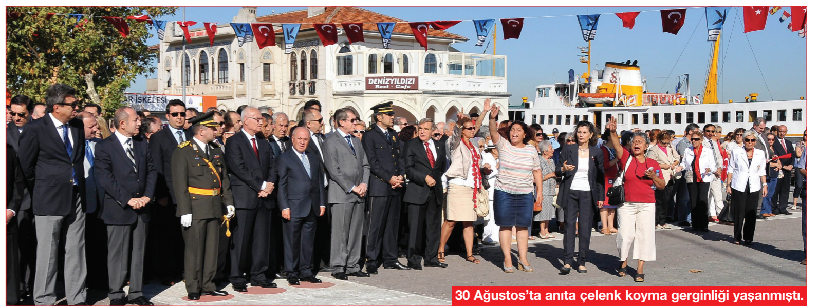
30 Ağustos'ta anıtı çelenk koyma gerginliği yaşanmıştı.

12 KASIM'da İBB Meclisi'nde CHP'ilerin ret oyuyla karşı AKP'li üyelerin çoğunluğuyla onaylanan "Kadıköy İlçesi, 08.10.2012 Tasdik Tarihi 1/5000 ölçekli Haydarpaşa Gar, Kadıköy Meydanı ve Çevresi Koruma Amaçlı Nazım İmar Planı", Kadıköy Belediyesi'nde askıya çıkmıştı. 12 Aralık Çarşamba'ya dek süren askı süresinde plana itirazlar yapıldı Kadıköy Belediyesi de plana olan itirazlarını İBB'ye sundu. Askı süresi içinde plana yapılan itirazlar daha sonra İBB Meclisi'ne gelerek tartışılacak. İtirazlardan sonra plan son şeklini kazanacak. Ancak itirazların Belediye Meclisi tarafından kabul edilmemesi halinde yargıya başvuru yapılabilir.